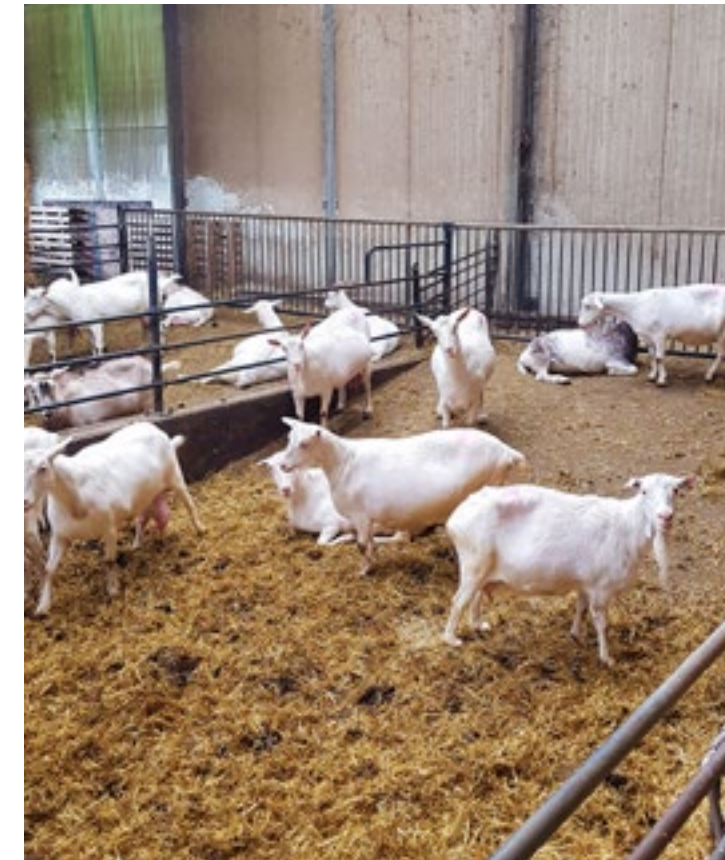
Hoeveel keuze willen we geiten bieden om een fijne ligplaats te kiezen? En weten we in voldoende mate wat zij als fijn ervaren?

De evaluatie heeft onder andere al opgeleverd dat diergebonden